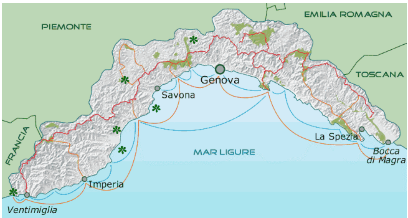
Il percorso dell'Alta Via dei Monti Liguri

Al termine di queste due fasi viene organizzato un incontro finale all'interno del quale vengono presentati i risultati del progetto e condivise le strategie di azione proposte.