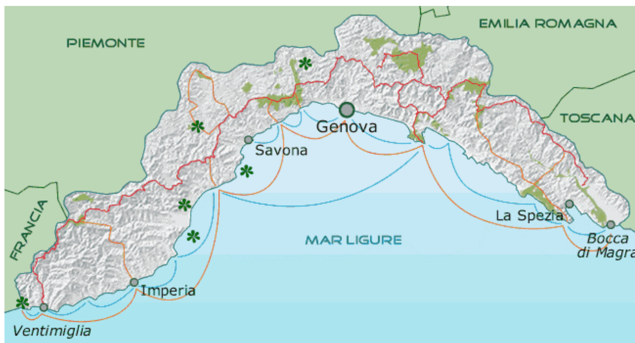
Il percorso dell'Alta Via dei Monti Liguri

Al termine di queste due fasi viene organizzato un incontro finale all'interno del quale vengono presentati i risultati del progetto e condivise le strategie di azione proposte.