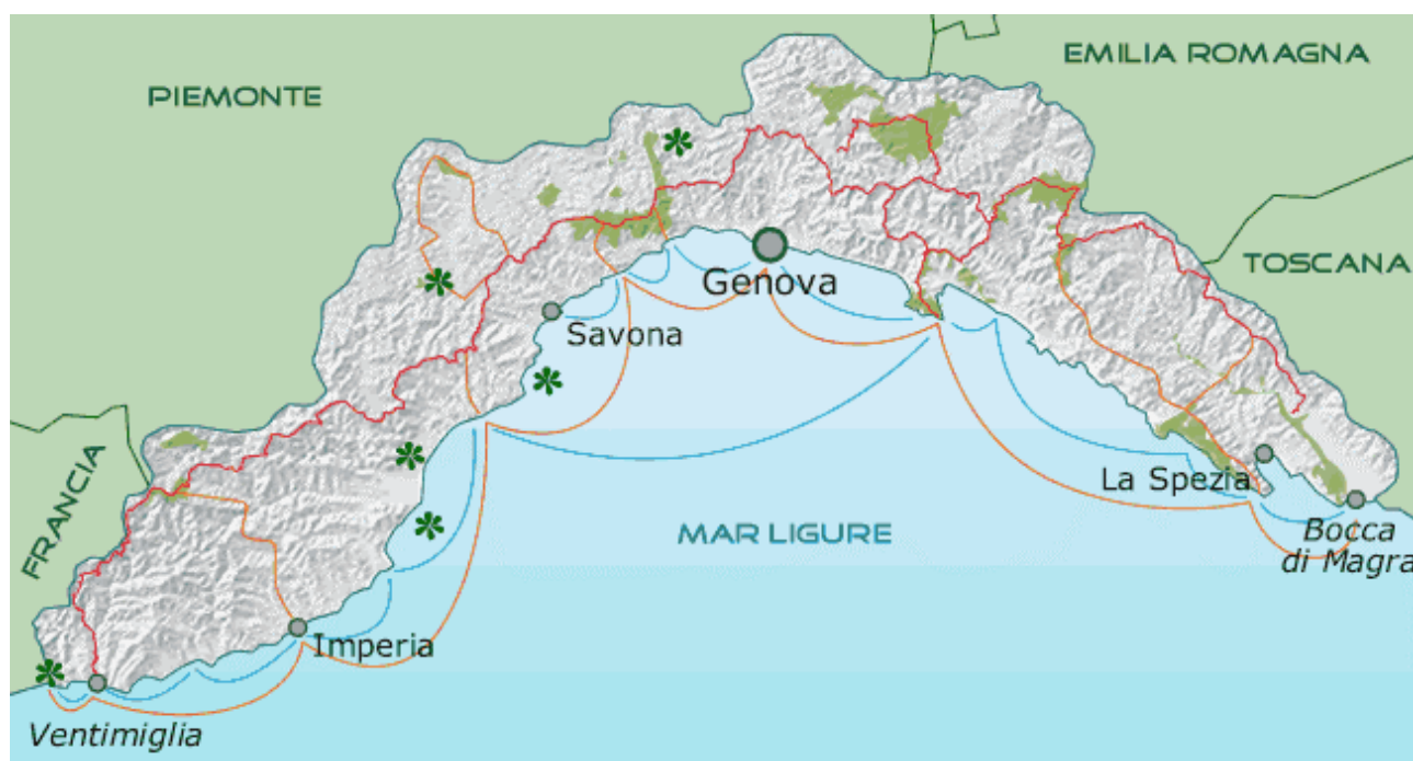
Il percorso dell'Alta Via dei Monti Liguri

Al termine di queste due fasi viene organizzato un incontro finale all'interno del quale vengono presentati i risultati del progetto e condivise le strategie di azione proposte.