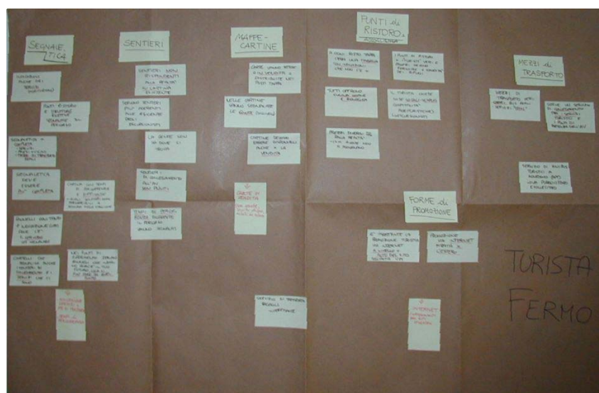
Il cartellone elaborato dal gruppo "Turista fermo"

Dalla discussione sono emerse sia problematiche che possibili proposte per migliorare la gestione dell'offerta turistica. Con il supporto del moderatore, i temi emersi durante la discussione sono stati organizzati su un cartellone e al termine del lavoro dei gruppi questo è stato esposto e commentato a tutti i partecipanti all'incontro.