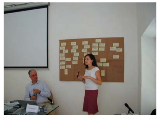
Esposizione del lavoro di un gruppo

Dedicandoci in questo periodo ai restanti incontri preliminari sarà interessante in un secondo momento fare un'analisi comparativa con i risultati emersi dai lavori nelle altre province liguri!