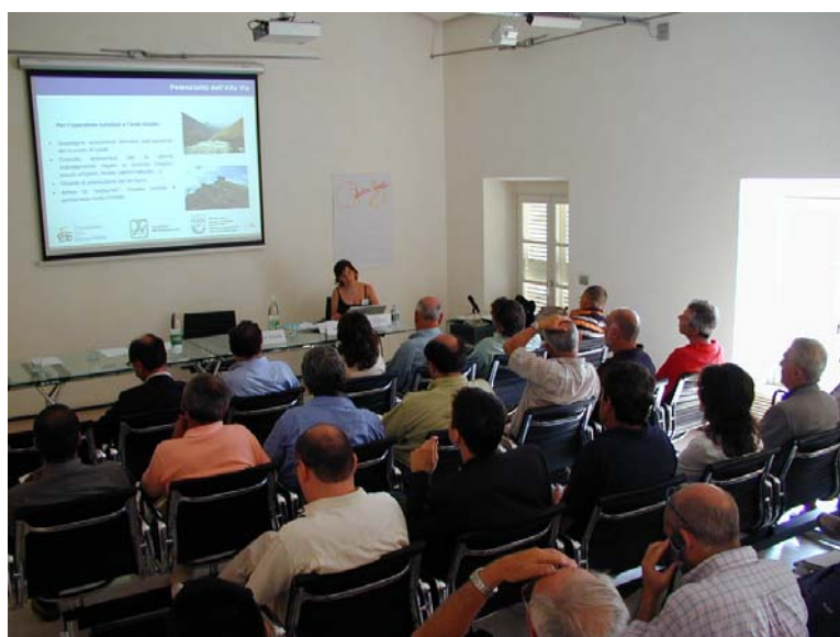
Apertura dei lavori in sessione plenaria