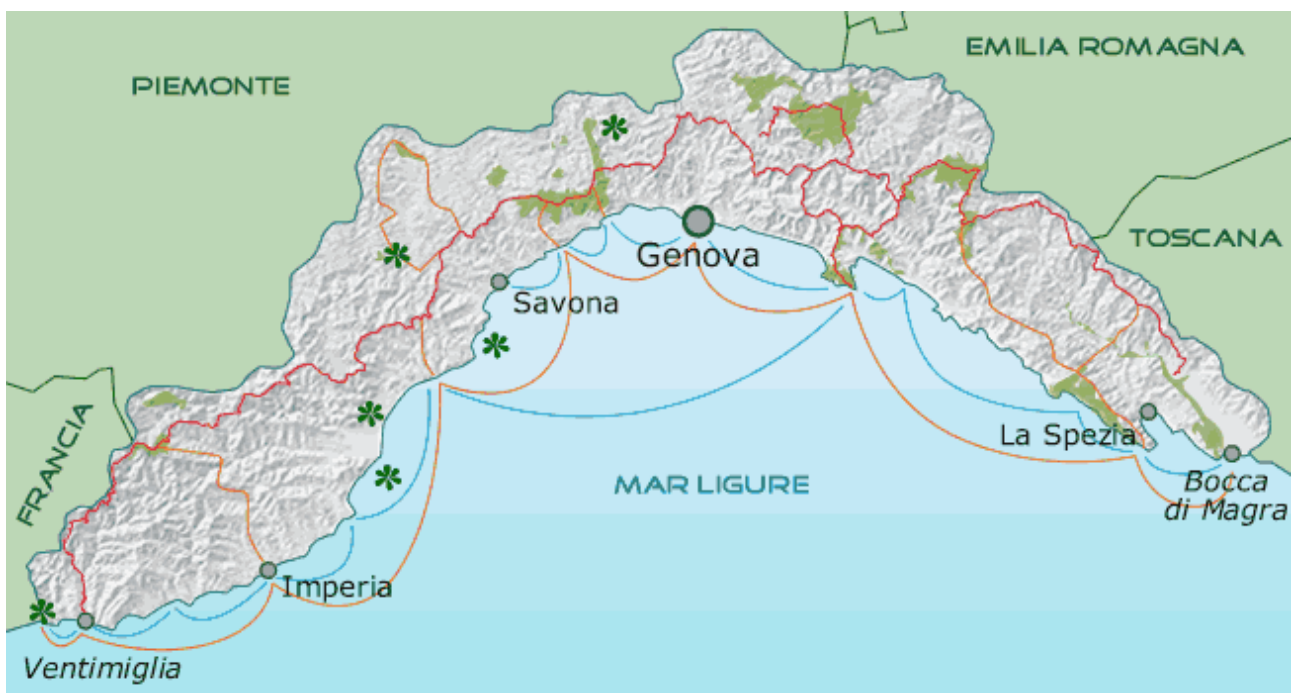
Il percorso dell'Alta Via dei Monti Liguri

Al termine di queste due fasi viene organizzato un incontro finale all'interno del quale vengono presentati i risultati del progetto e condivise le strategie di azione proposte.