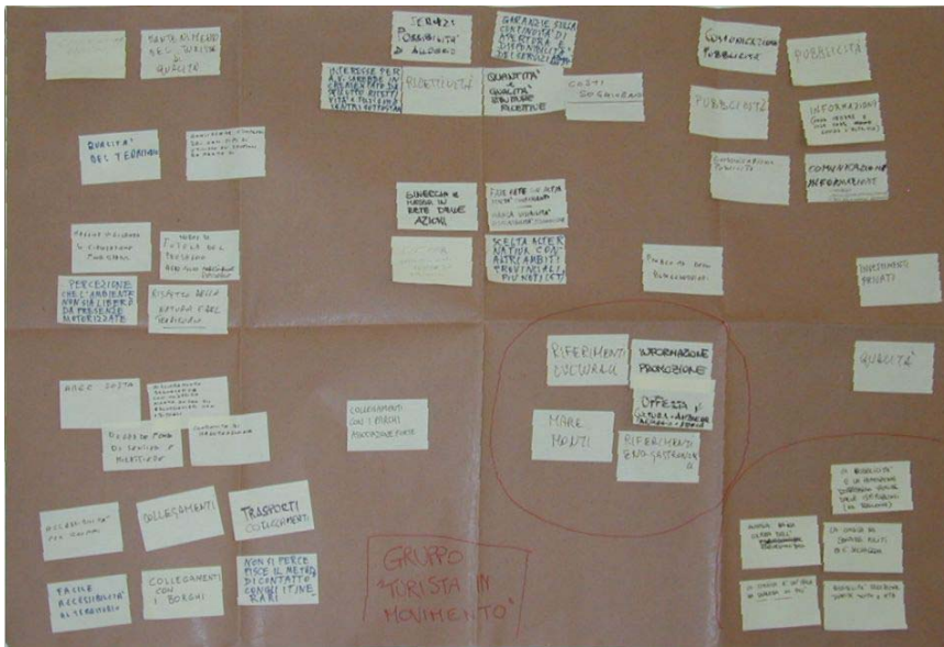
Ed ecco il secondo cartellone, quello elaborato dal gruppo "Turista in movimento".